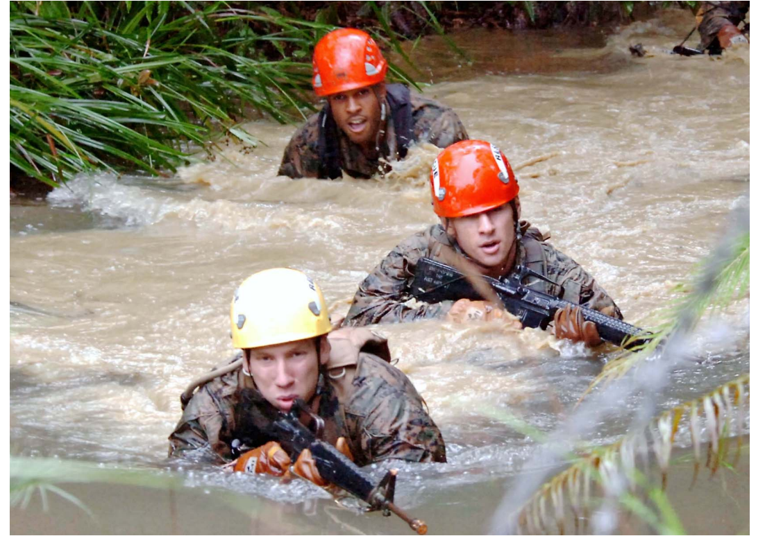
米軍北部訓練場内の川にっかりながら前進する訓練を行う米兵＝2006年6月、東村高江の米軍北部訓練場

2009年発足の鳩山政権が県外移設模索を断念した際、「(辺野古以外では)地上部隊とヘリ部隊の一体運用ができない」などとしていたが、ヘリ部隊が1969年に沖縄に移転してくるまで、地上部隊とヘリ部隊は別々の土地を拠点に活動していた。